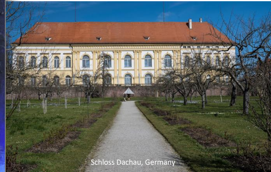
Schloss Dachau, Germany